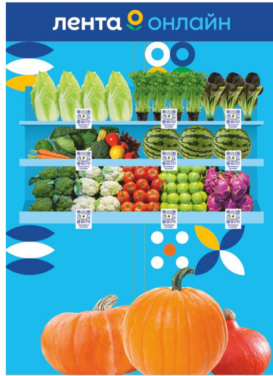
Свежие овощи и фрукты