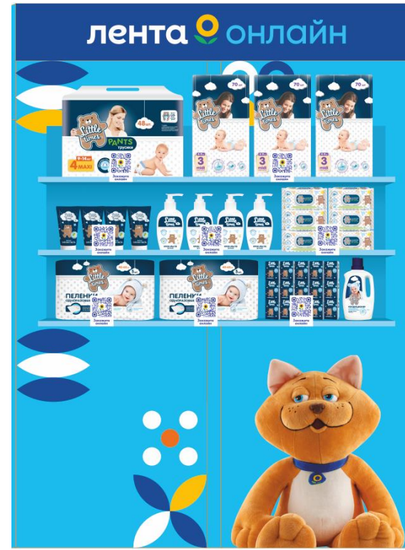
Товары для детей